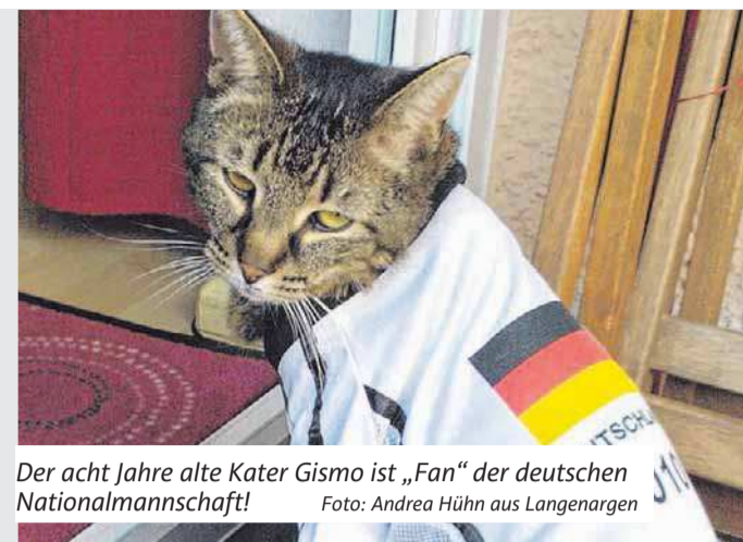
Der acht Jahre alte Kater Gismo ist „Fan“ der deutschen Nationalmannschaft!