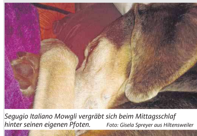
Segugio Italiano Mowgli vergräbt sich beim Mittagsschlaf hinter seinen eigenen Pfoten.

Patienten kommen mit komplizierten Kieferfehlstellungen oder Verletzungen aber auch für Routineeingriffe in die Praxis.