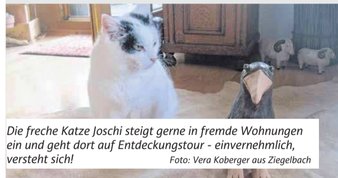
Die freche Katze Joschi steigt gerne in fremde Wohnungen ein und geht dort auf Entdeckungstour - einvernehmlich, versteht sich!

Südfinder-Leser schicken Schnappschüsse ihrer Haustiere