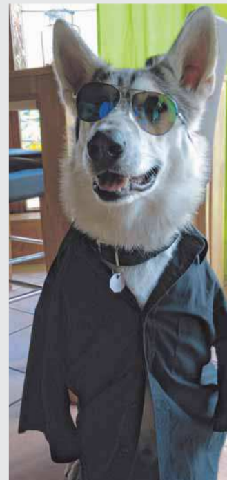
Siberian Husky Nanouk verändert gerne mal ihren Look.